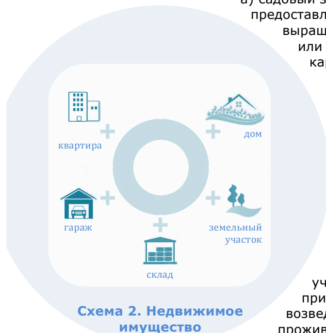
Схема 2. Недвижимое имущество